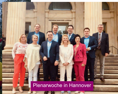
Plenarwoche in Hannover