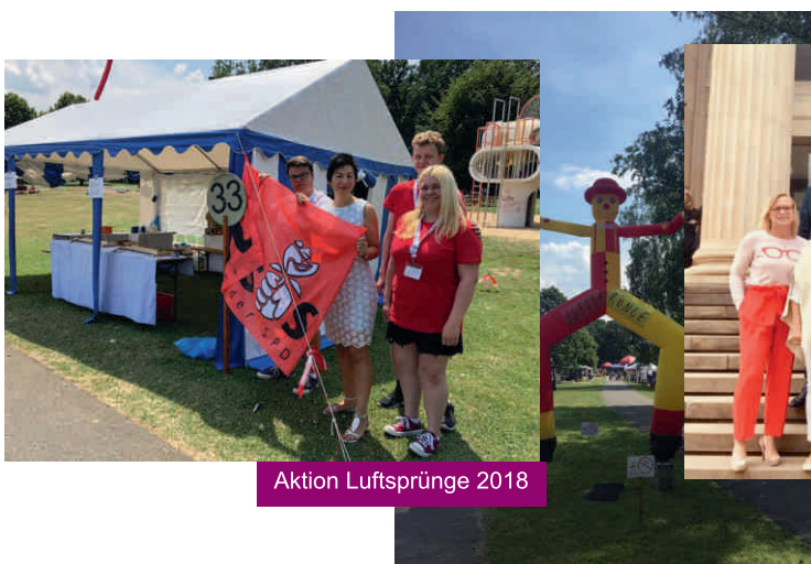
Aktion Luftsprünge 2018