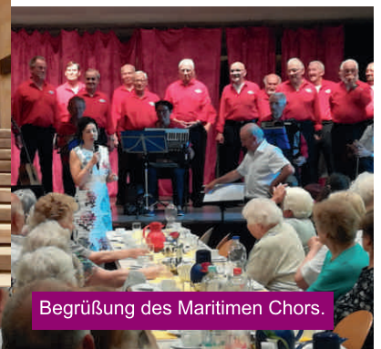
Begrüßung des Maritimen Chors.